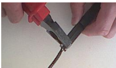
Vaihe 2: Purista metalliliitin kiinni pihdeillä