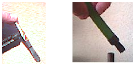
Vaihe 7. Varmista kutistesukan painuminen tiivisti nauhakytkimen pintaan koko matkalta. Varo vahingoittamasta päätevastusta