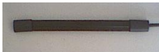
Vaihe 5: Kutistesukan pään on oltava vähintään 5 mm yli metalliliittimen