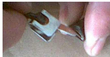
Vaihe 1: Aseta kupari kieli nauhakytkimen kontaktiliuskojen väliin