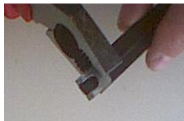
Vaihe 3. Toista vaiheet 1 ja 2 toiseen päähän. Purista metalliliitin tarkasti oikeaan kohtaan varoen vahingoittamasta päätevastusta